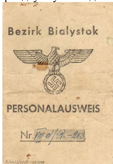
Пашпарт, выданы нямецкімі акупацыйнымі ўладамі акругі «Беласток». 13 красавіка 1943 г.