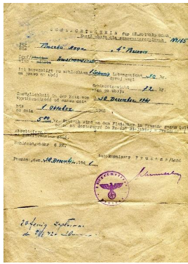
Дазвол нямецкай акупацыйнай улады на забой хатняй жывёлы. Пружаны. 30 снежня 1941 г.