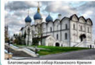
Благовещенский собор Казанского Кремля

Только мы сами должны стремиться иметь крепкую веру православную и любовь к Сыну Её – Господу нашему Иисусу Христу, стараться соблюдать Его Святые Заповеди.