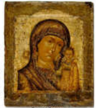
Древний список Казанской иконы Божией Матери

1579 год. Раскалённое, немилосердно палящее солнце, пыль столбом по дорогам Казани... Пыль и пепел от страшного пожара, который здесь похлал неделю назад. Начался он около церкви Святого Николая, затем перекинулся на Кремль Казанский. Причитали женщины, плакали дети – а ну как на дома перекинётся, тогда что будет?! А некоторые злорадно посмеивались: "Где ж ваш Бог был, что церковь-то сгорела? Видно, врут все священники ваши – вон похлало-то как!"