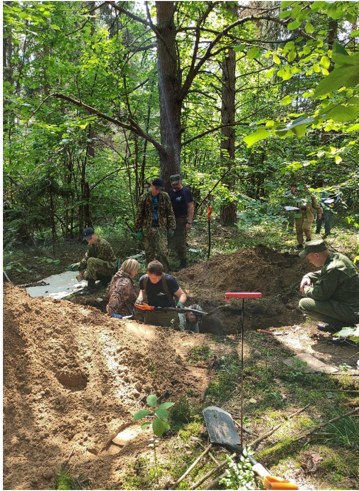
52-гі пошукавы батальён вядзе раскопкі каля в.Блізня (Пружанскі р-н). 2022 г.