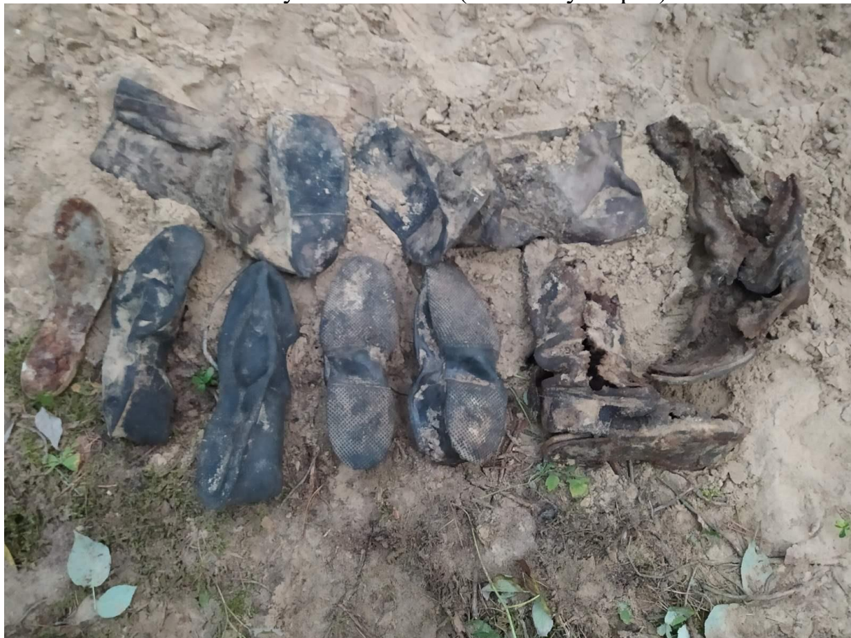
Астанкі і асабістыя рэчы забітых знойдзены 52-м пошукавым батальёнам каля в.Труханавічы (Пружанскі р-н). 2019 г.