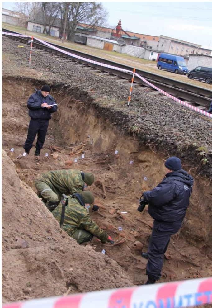
Месца масавага пахавання ахвяр фашызму ў 2021 г. выяўлена ў г.Лунінец (Брэсцкая вобл.)