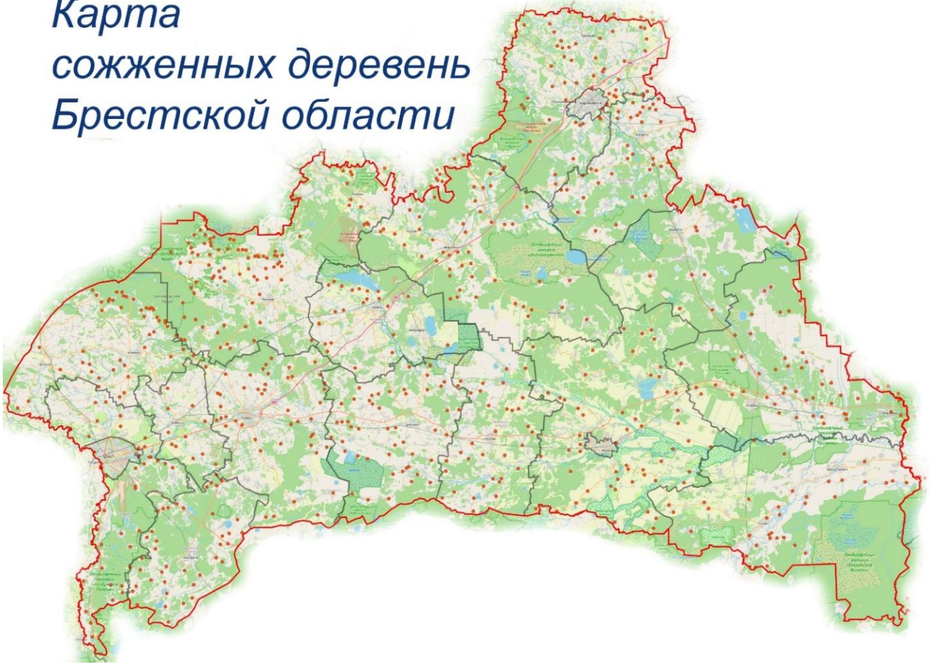
Карта спаленых вёсак Брэсцкай вобласці