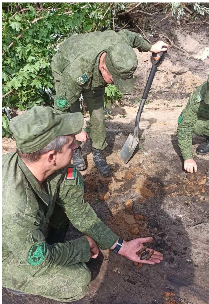
Раскопки ў пас.Ленінскі (Жабінкаўскі р-н). 2021 г.